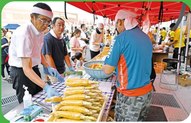
8月4日に田中支店で設立60周年記念JAIちかわ柏地区納涼まつりを開催しました