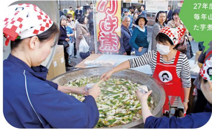
2015年11月1日開催の平成27年度感謝祭。感謝祭では毎年山形産のサotimeを使った芋煮を販売しています