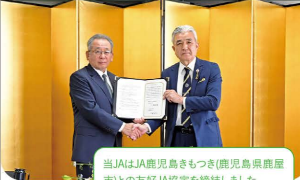
当JAはJA鹿児島もつき(鹿児島県鹿屋市)との友好JA協定を締結しました。双方の農産物のPR販売や大規模災害発生時の支援活動などを行います