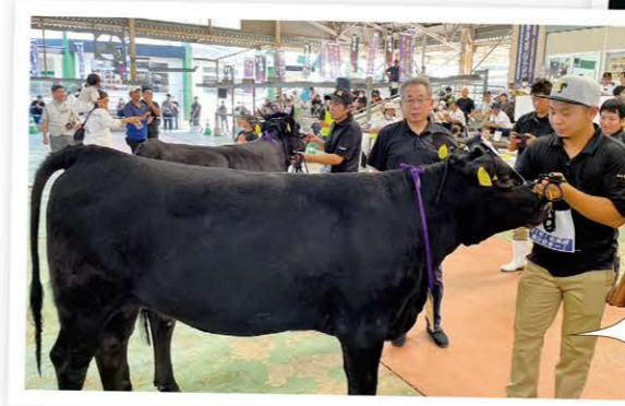
9月30日に鹿児島県始良市で令和5年度第72回鹿児島県畜産共進会が開催。会場はよりよい食肉牛を生産しようとする生産者らの熱意で包まれていました