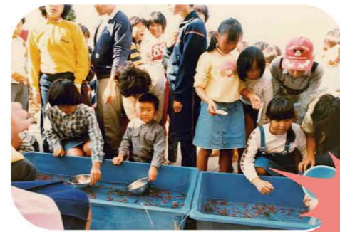
第1回感謝祭で設けられたチビっ子広場内の金魚すくい