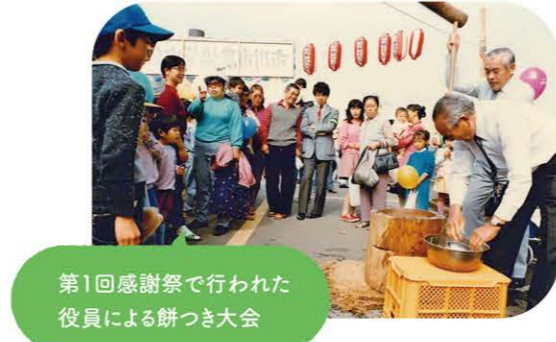
第1回感謝祭で行われた役員による餅つき大会

また、国府台女学院小学部の児童が作った貼り絵の展示やチビっ子広場なども設けられ、両日とも大盛況。2日間で延べ8000人が来場しました。 その後も第4回では綱引き大会、第15回では市川市立北方小学校のブラバンド演奏などさまざまな催し物を行ってきました。 一方、船橋市農協では82年4月24日と25日に船橋市二宮農協との合併1周年を記念した第1回農協祭が行われました。86年5月25日開催の第7回農協祭では高根神楽が披露されるなど、地域密着の祭りとして行われていました。 2004年10月30日に開催した第20回の感謝祭はJA船橋市との合併で本店、行徳支店、船橋支店の3会場で開催（行徳支店は10年、船橋支店は12年まで）。 JA田中は1980年10月17日と18日の2日間、田中農協農業祭を開催。JA市川市との合併後も田中まつりとして続けられ、10月14日には設立60周年記念JAいちかわ田中まつりが開催されました。 各地域の恒例の行事として根付いているJAのお祭り。今年の感謝祭は11月18日に市川市の本店で行われる予定です。