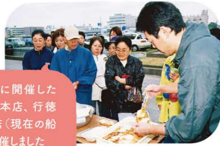
2004年10月30日に開催した第20回感謝祭は本店、行徳支店、船橋市支店（現在の船橋支店）で同時開催しました

また、国府台女学院小学部の児童が作った貼り絵の展示やチビっ子広場なども設けられ、両日とも大盛況。2日間で延べ8000人が来場しました。 その後も第4回では綱引き大会、第15回では市川市立北方小学校のブラバンド演奏などさまざまな催し物を行ってきました。 一方、船橋市農協では82年4月24日と25日に船橋市二宮農協との合併1周年を記念した第1回農協祭が行われました。86年5月25日開催の第7回農協祭では高根神楽が披露されるなど、地域密着の祭りとして行われていました。 2004年10月30日に開催した第20回の感謝祭はJA船橋市との合併で本店、行徳支店、船橋支店の3会場で開催（行徳支店は10年、船橋支店は12年まで）。 JA田中は1980年10月17日と18日の2日間、田中農協農業祭を開催。JA市川市との合併後も田中まつりとして続けられ、10月14日には設立60周年記念JAいちかわ田中まつりが開催されました。 各地域の恒例の行事として根付いているJAのお祭り。今年の感謝祭は11月18日に市川市の本店で行われる予定です。