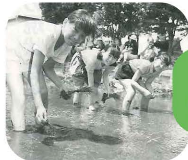
1991年5月26日開催の船橋市農協第11回農協祭では船橋市立峰台小学校の親子が田植えを体験しました