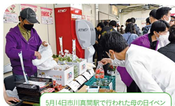
5月14日市川真間駅で行われた母の日イベントでは市川野菜「いちべじ」を販売しました