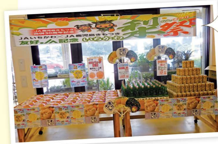
どっ菜市場内に開設された「市川のなし」特別販売コーナー

また、昨年鹿児島県で開催された和牛のオリンピックともいわれる「第12回全国和牛能力共進会」でJA鹿児島きもつき管内の黒牛が内閣総理大臣賞を受賞しており、同JAが注力する畜産への理解を深めようと、当JA役職員は9月30日に鹿児島県始良市の始良中央市場で開催された令和5年度「第72回鹿児島県畜産共進会」を見学しました。