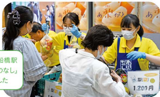
8月18日と19日、西船橋駅(船橋市)で「市川のなし」のPR販売を行いました