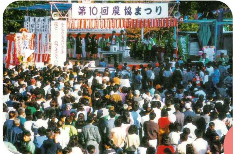
1989年11月3日に開催した田中農協の第10回農協まつり