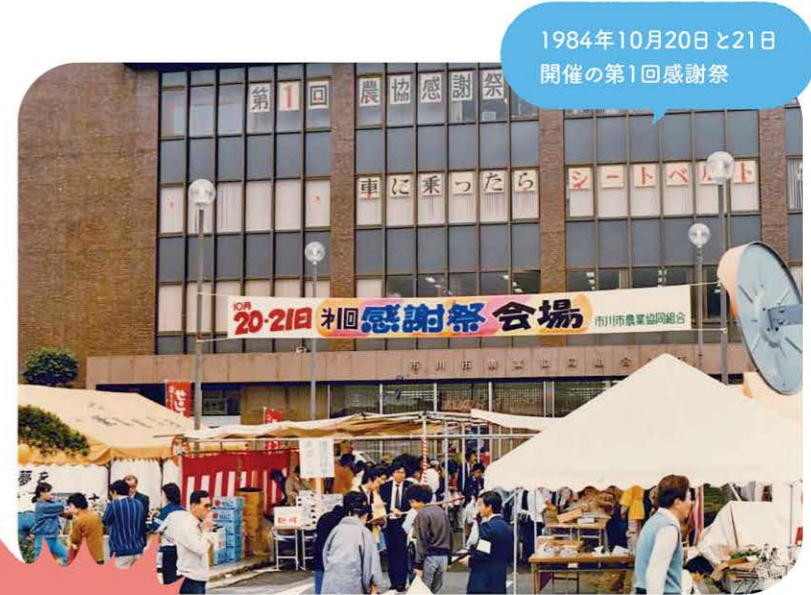
1984年10月20日と21日開催の第1回感謝祭