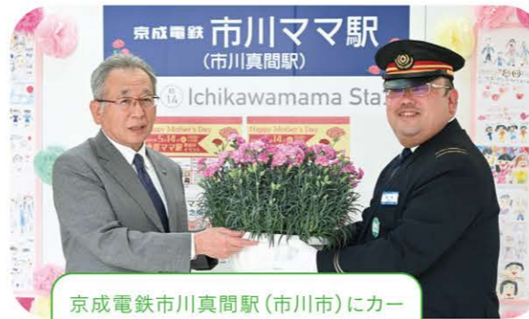
京成電鉄市川真間駅(市川市)にカーネーションを60鉢を贈りました