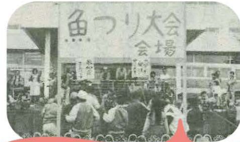
第1回田中農協農業祭。田中農協本店の他、建設前の十余二支店、若柴、田中農協病院の4カ所で同時開催し、野菜の即売会や餅つきの他、ゲートボール大会や魚つり大会などを行いました。2日間で延べ8000人近くが来場しました