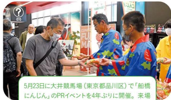
5月23日に大井競馬場(東京都品川区)で「船橋にんじん」のPRイベントを4年ぶりに開催。来場者500人に「船橋にんじん」を無料配布しました