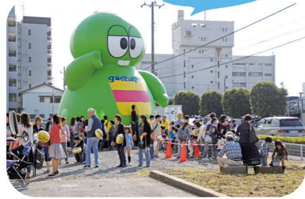
2012年10月20日開催の平成24年度JAいちかわ感謝祭船橋支店会場。人気キャラクターの大きなふわふわ人形が子どもたちに大人気でした