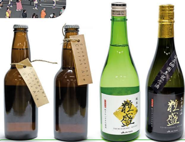
「船橋にんじん」を使ったクラフトビールや田中地区で栽培したお米「粒すけ」を使い、設立60周年を記念した大吟醸「粒盛」を発売しました