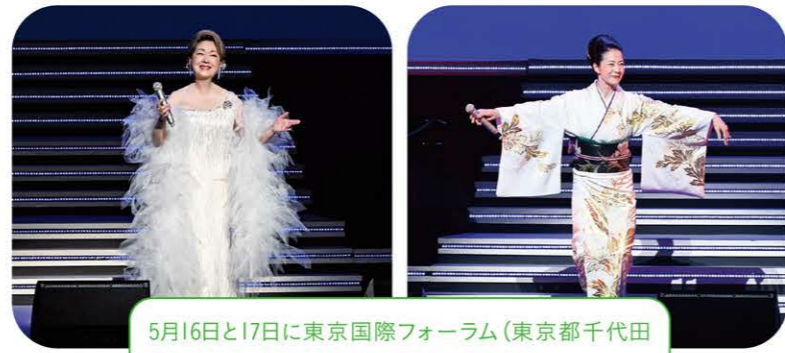
5月16日と17日に東京国際フォーラム(東京都千代田区)で設立60周年記念感謝の集いを開催。来場した約1万1500人に由紀さおりさんと坂本冬美さんのジョイントコンサートをお楽しみいただきました