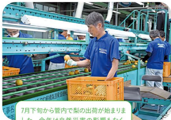
7月下旬から管内で梨の出荷が始まりました。今年は自然災害の影響もなく、例年通りのおいしさを全国に届けました