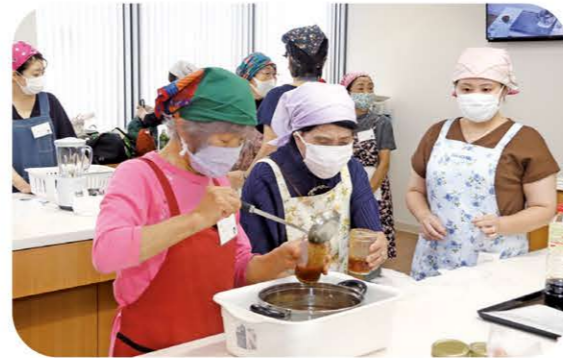
梨を使った焼き肉のたれ作り (2022年9月)

農業をもっと身近に感じてほしい…。JAは准組合員を対象にカルチャー教室を開催。苗の植え付け体験や収穫体験、特産の梨を使った焼き肉のタレ作り、手作り味噌(みそ)づくりなど食と農の大切さを伝える講習を開いています。