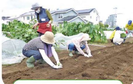
農業体験として2023年9月にハクサイとブロッコリーの苗植えとダイコンの種まきを体験、11月に収穫しました