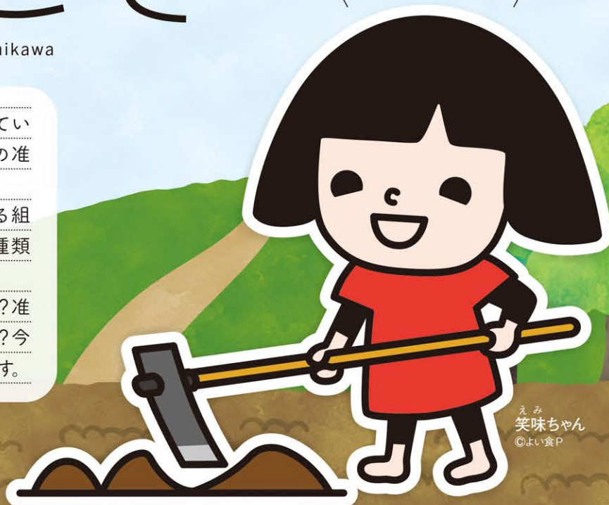
えみ 笑味ちゃん

協同組合と組合員の関係性は? 准組合員とは? 准組合員のメリットは? 今号ではそのような疑問にお答えします。