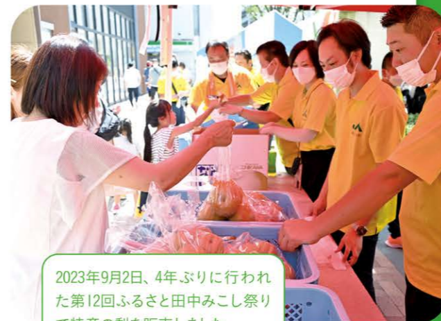
2023年9月2日、4年ぶりに行われた第12回ふるさと田中みこし祭りで特産の梨を販売しました