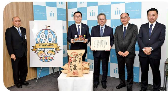
当JAはチューリップの球根3000個と「柏こだわり田中産こしひかり」Itを市川市に贈りました。米は市川市の生活困窮者対策に無料でカレーライスを提供する「いちカレ」事業で使います