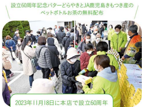
設立60周年記念バターどらやきとJA鹿児島きもつき産のペットボトルお茶の無料配布