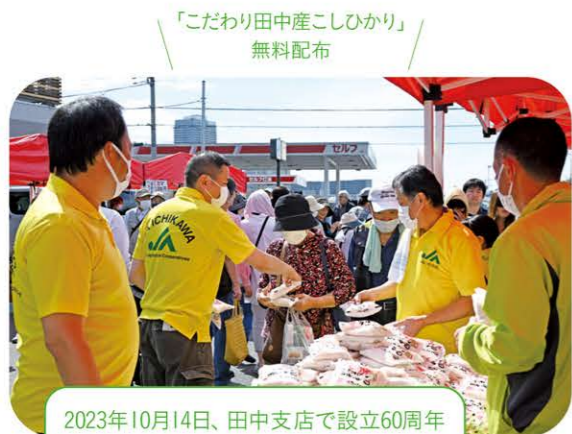
「こだわり田中産こしひかり」無料配布