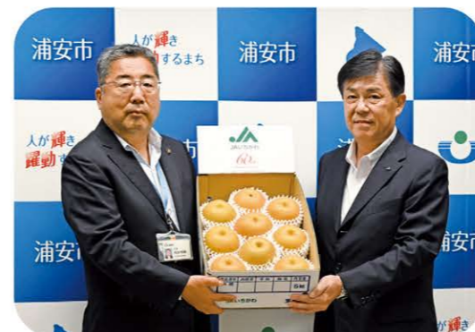
当JAは市川市内の小学校5年生に子ども向け農業雑誌「ちやくりん」を、管内4市の福祉施設に梨を贈りました