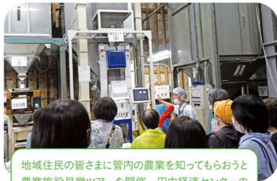
地域住民の皆さまに管内の農業を知ってもらおうと農業施設見学ツアーを開催。田中経済センターの精米施設と船橋梨選果場を見学してもらいました