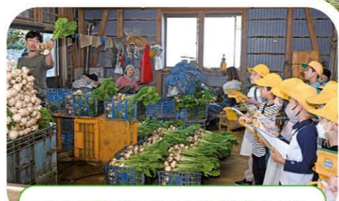
子どもたちに食と農の大切さを伝えようと農業生産現場への受け入れを行っています