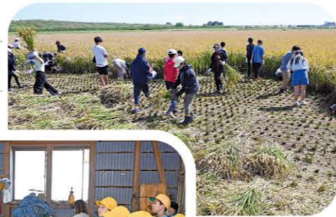
柏市立花野井小学校5、6年生稲刈り体験