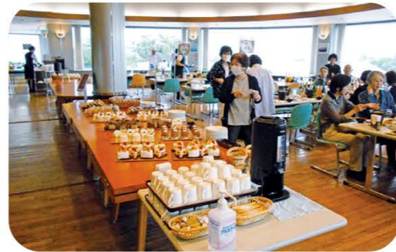
お楽しみいただいたシャトレゼベルフォーレワイナリーでのデザートビュッフェ付きランチ