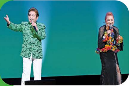
市川地区年金友の会は2023年9月14日、市川市文化会館で第3回芸能大会を開きました。会員が日頃から練習する歌や踊りと北原ミレイさんと平浩二さんの歌謡ショーを楽しみました