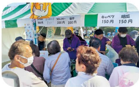
2023年11月3日に市川市の大洲防災公園で開催した第48回いちかわ市民まつりで市川市産野菜「いちべじ」や花を販売しました