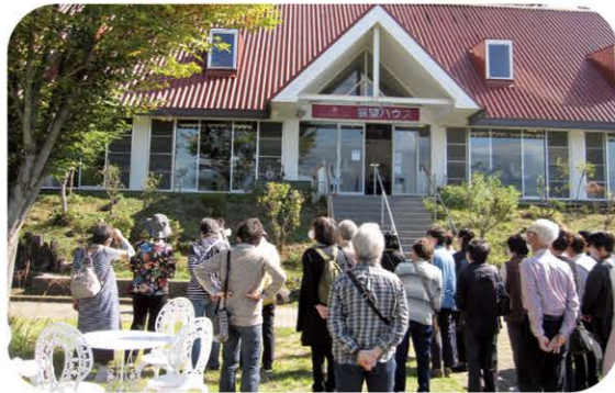
山梨県甲斐市のシャトレゼベルフォーレワイナリーで

昨年は山梨県甲斐市のシャトレゼベルフォーレワイナリーなどを巡るツアーを開催。お昼にはデザートビュッフェ付きのランチをお楽しみいただきました。