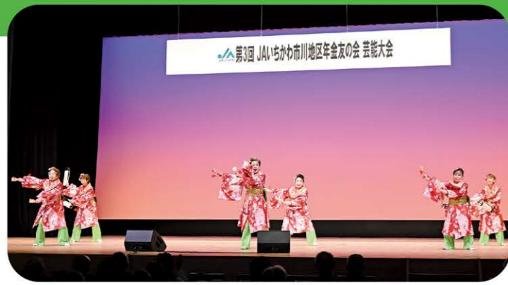
第3回 JAIいちかわ市川地区年金友の会 芸能大会