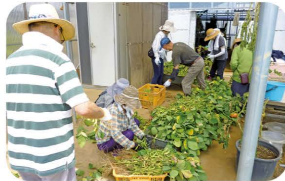
エタマメ・トウモロコシの収穫体験 (2023年7月)